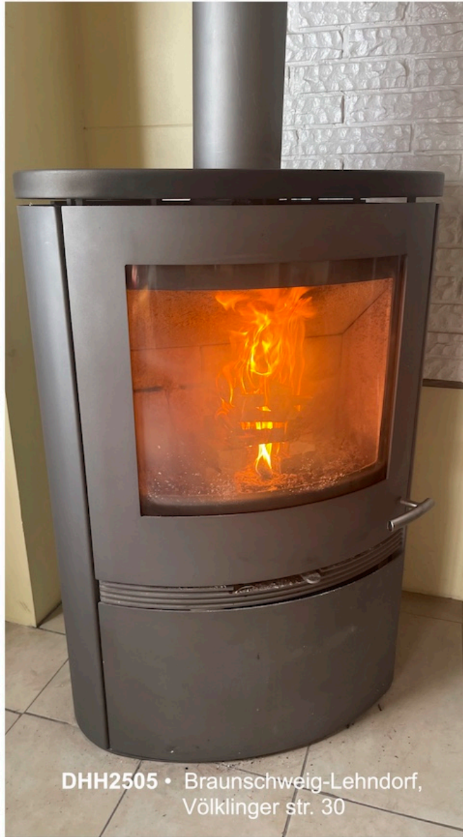
DHH2505 • Braunschweig-Lehndorf, Völklinger str. 30