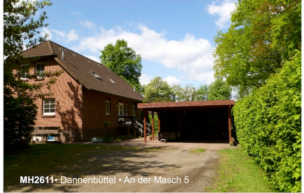
MH2611 • Dannenbüttel • An der Masch 5